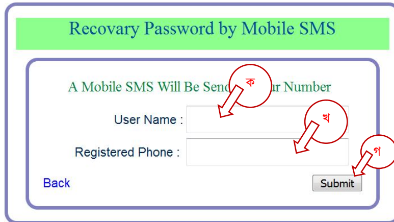
চিত্রঃ Recovery Password by Mobile SMS

বিদ্র: প্রত্যেক SMS এর জন্য 75 পয়সা খরচ হবে।