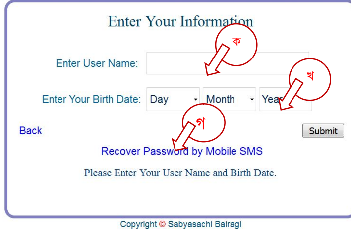
চিত্রঃ Password Recovery Box

খ. Enter Your Birth Date: (খ) নির্দেশনা নম্বরে আপনার Birth Date প্রবেশ করান। এর পর Submit বাটনে ক্লিক করুন। Message Box এ আপনার Password দেখতে পারবেন।