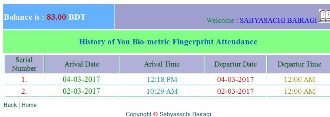
চিত্রঃ History of Your School Arival and Departure

৩। School Arrival and Departure: প্রতিদিন ছাত্র-ছাত্রীরা কখন স্কুলে উপস্থিত হচ্ছে এবং কখন স্কুল থেকে প্রত্যাবর্তন করছে নিচের চিত্রের মত তা দেখতে পারবেন।